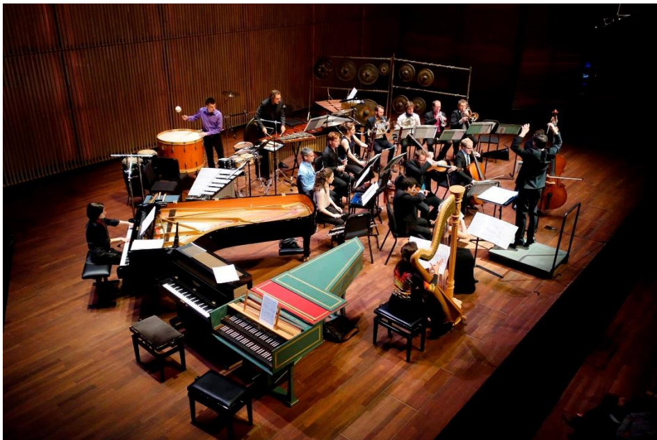
Viva Italia – KC Lab

Het New European Ensemble verzorgt regelmatig de wereldpremières van belangrijke ensemblestukken van internationaal gerenommeerde componisten. Op 10 en 13 april stond het ensemble centraal in het Joods Cultureel Seizoen in Stockholm en Malmö met een wereldpremière van de Spaanse componist José-Maria Sanchez-Verdu. Zijn stuk Libro del jardin de arena grijpt terug naar de architectuur van de bloeiende samenleving van de Moorse tijd in Spanje waarin joden, moslims en christenen vredig met elkaar leefden. Het stuk is een soort levende installatie waarin de musici tegenover elkaar in de vorm van een davidster worden opgesteld. Het bevat zijn typische verstilde klanken waarin we een muziek 'achter de muziek' waarnemen. Het tourneeprogramma werd aangevuld met verdere werken van Sanchez-Verdu en György Kurtag.